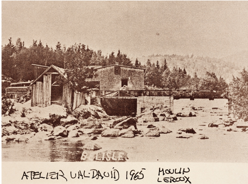
MOULIN LEROUX 1964/1965 dans l'île Val-David