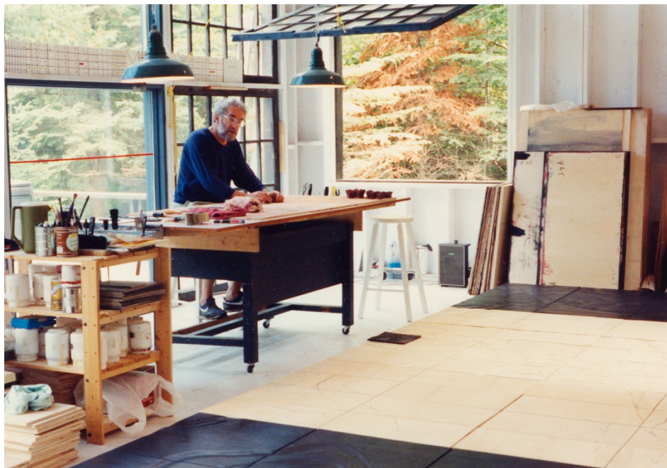
2 e Atelier aujourd'hui l'accueil des Jardins du Précambrien