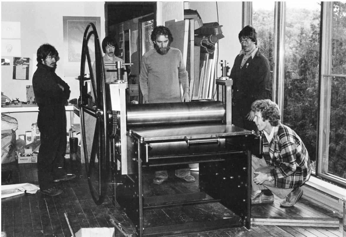
1977 La presse à gravure réalisé à Sainte Agathe par Monsieur Marinier première presse à gravure réalisée au Québec. Monsieur Marinier de Sainte Agathe a réalisés 5 autres presses pour des institutions au Québec