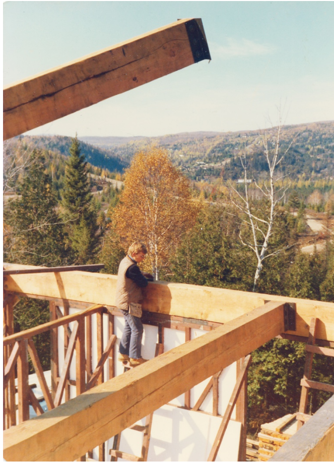
Construction de la Mison 1975 Montée Gagnon