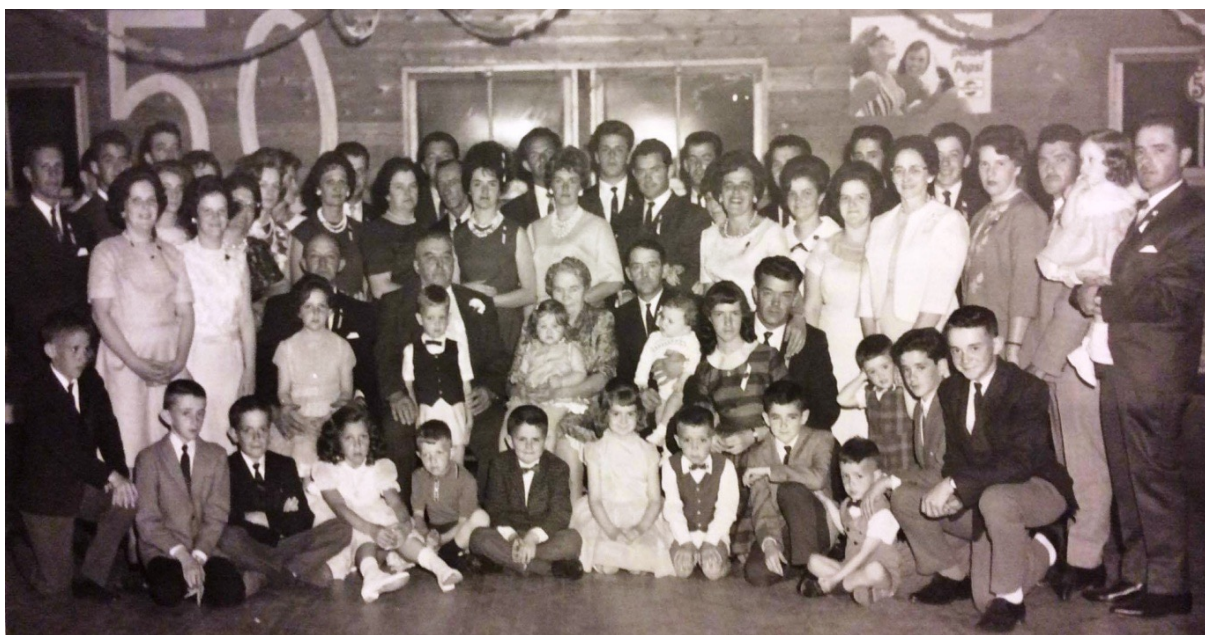
LE 50 E ANNIVERSAIRE DE MARIAGE, À LA SALLE LAROCHE, LE 11 MAI 1964